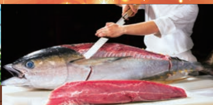
大好評「マグロの一刀おろし」〈阿波三味〉