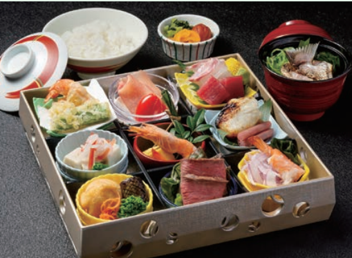
「藍彩 旬彩箱」※写真はイメージです。

【有効期限】 2025年10月1日(水)～2026年3月31日(火) 【除外日:ダイニングカフェクレメントのみ】 2025年12月20日～2026年1月4日まで ★徳島駅クレメント駐車場が2時間無料でご利用いただけます!