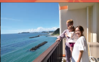
オーシャンフロントのお部屋