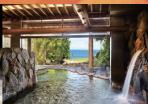
潮の香りをを感じる天然温泉